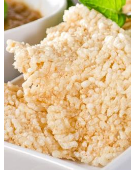
40 Mommy-made fried rice crackers ข้าวตังทอด 自制炸年糕