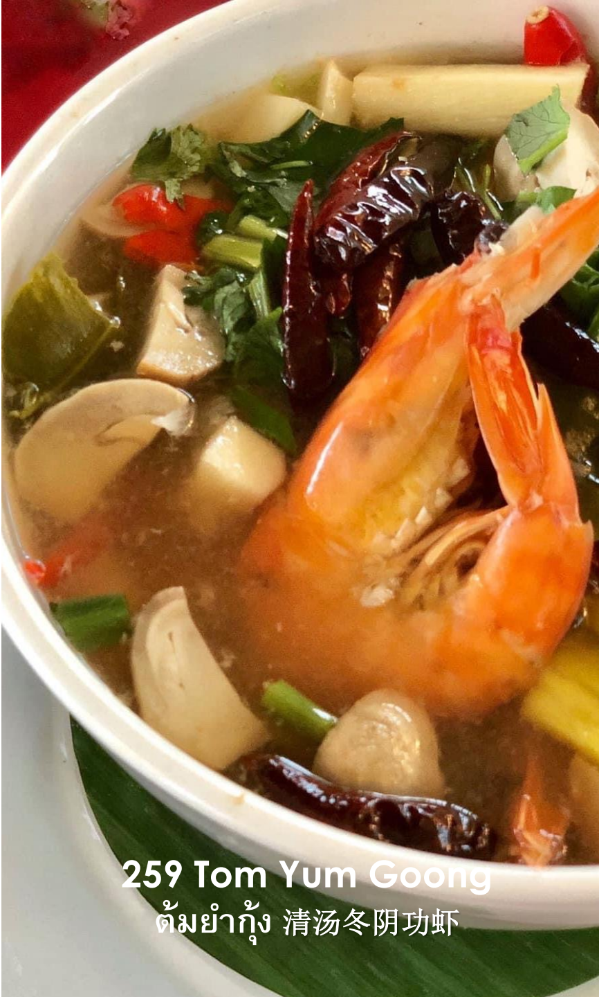
259 Tom Yum Goong ต้มยำกุ้ง 清汤冬阴功虾