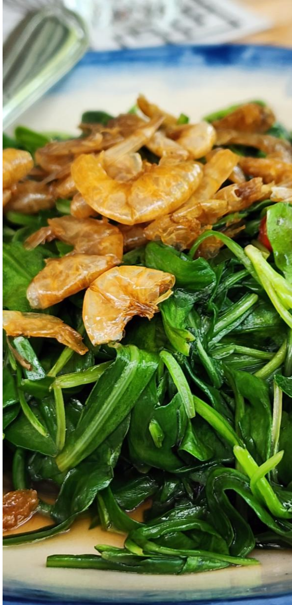
189 Andaman Vegetable ผักลิ้นห่านไฟแดง 炒安达曼海菜 不可错过