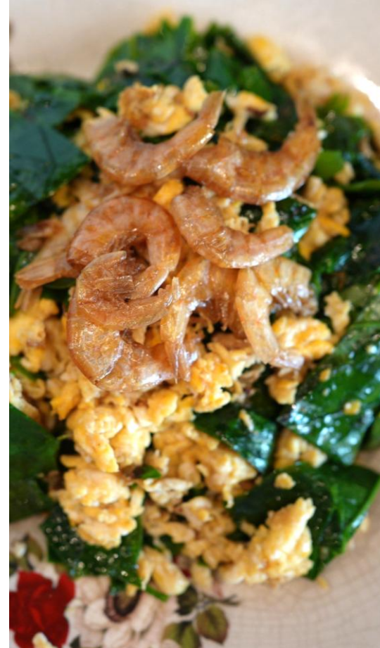
★ 169 Mieng vegetable w/organic eggs ใบเหมียงผัดไข่ 莧菜炒蛋