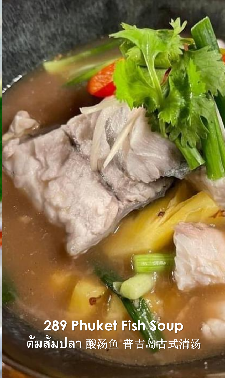
289 Phuket Fish Soup ต้มส้มปลา 酸汤鱼 普吉岛古式清汤