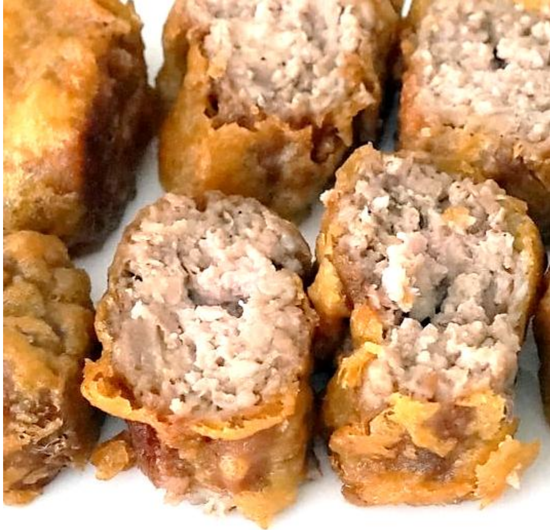
189 Traditional Phuket-Fujian sausage