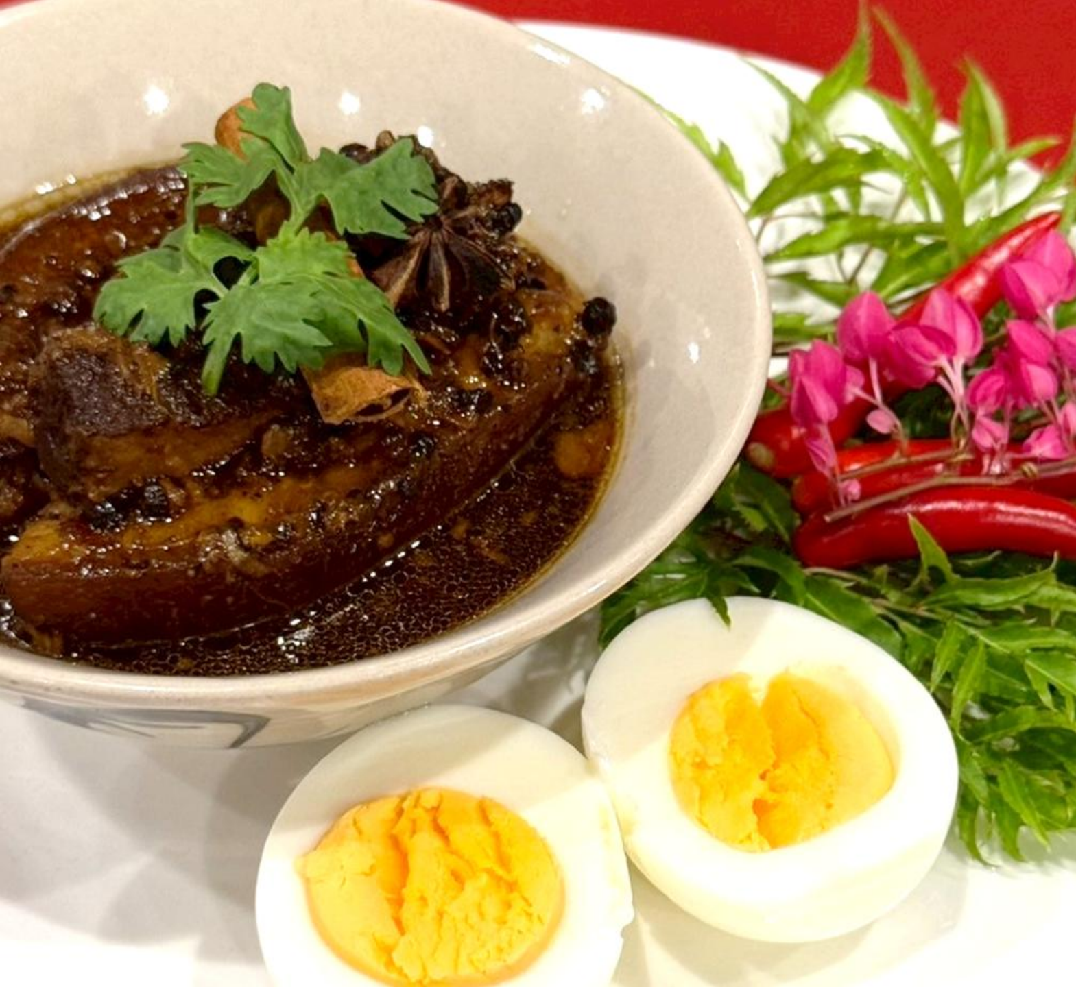
★ 259 Phuket 6-hr-stewed pork หมูฮ้อง 炖6小时的猪肉浓汤