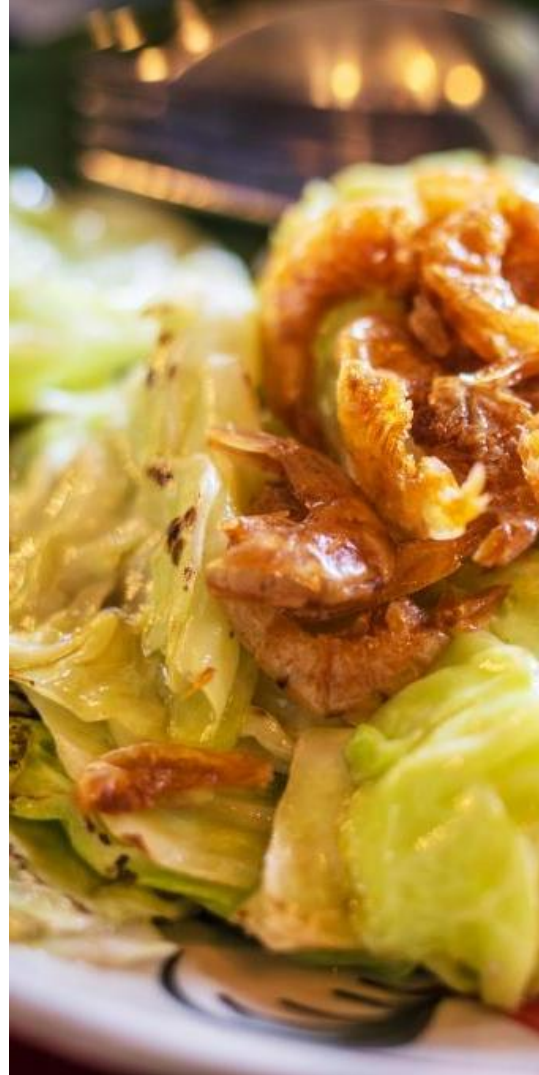
129 Cabbage w/ crispy sea prawns กะหล่ำปลีกุ้งเสียบ 包菜炒虾串