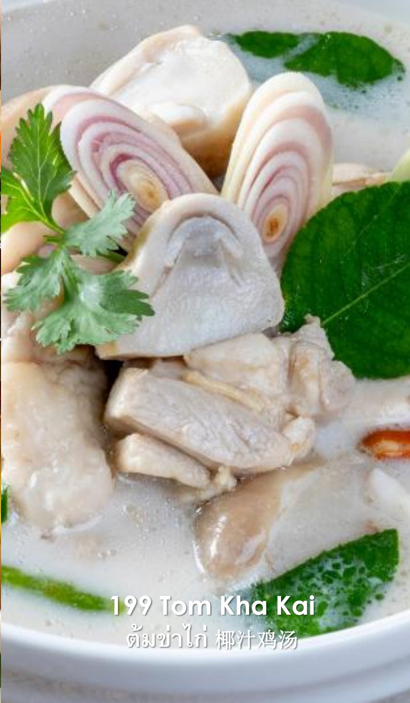
199 Tom Kha Kai ต้มข่าไก่ 椰汁鸡汤