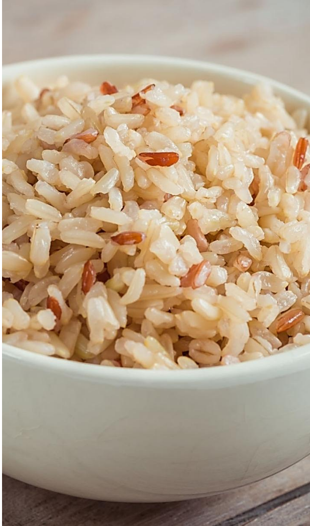
40 Signature brown rice from 3 best local communities in Thailand ข้าวออแกนิกจาก 3 ชุมชน -有机白米饭