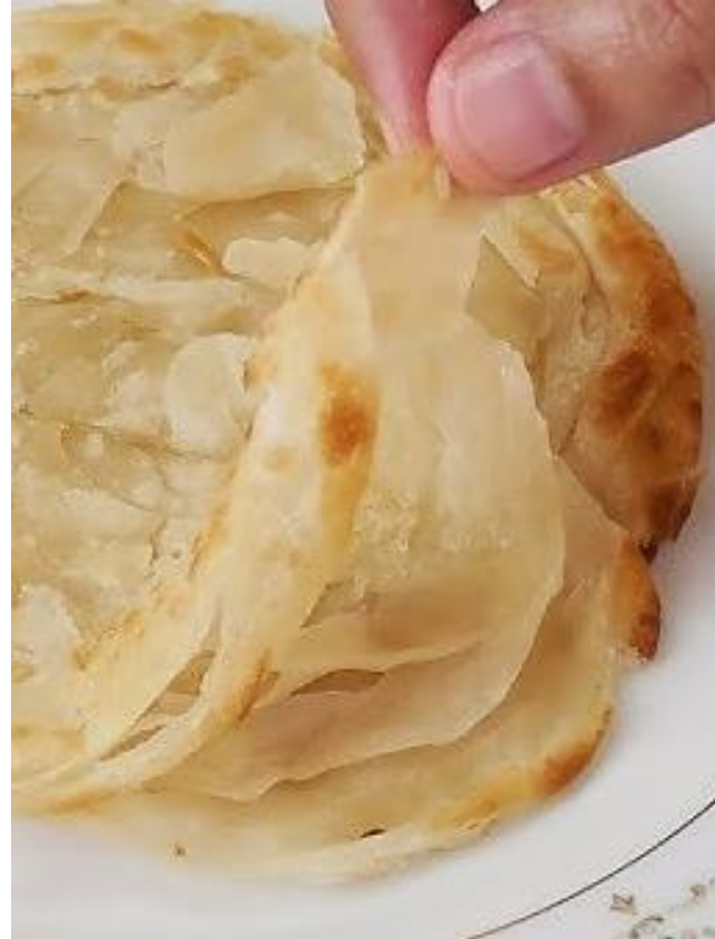
40 Charcoal grilled roti โรตีย่างเตาถ่าน 自制印度薄饼